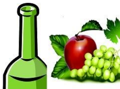
Fruits et vin de Metz

Le soutien de la Fondation permettra l'acquisition d'outils pour la culture, de pieds de vigne, de deux ruches.